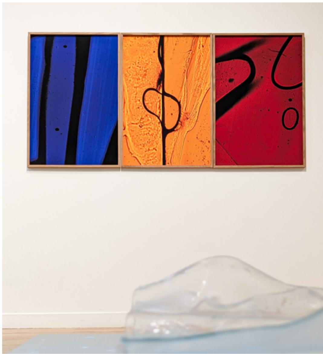
Marguerite Bornhauser, Les éruptions solaires, 2025